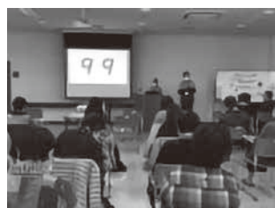
地区福祉委員会研修会