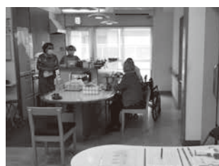
誰もが集えるリビング活動

社会福祉法人 岸和田市社会福祉協議会 〒596-0076 岸和田市野田町1丁目5番5号 岸和田市立福祉総合センター2階 電話 072 (437) 8854