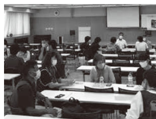
市民活動ステーションコラボ