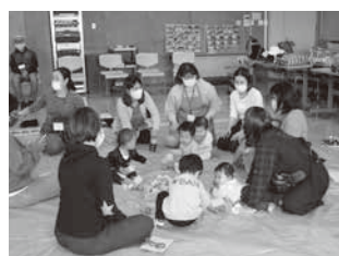
子育てサロン活動